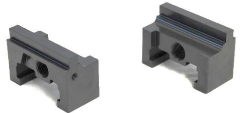
Backensatz mit glatter Spannstufe für RS-Z75