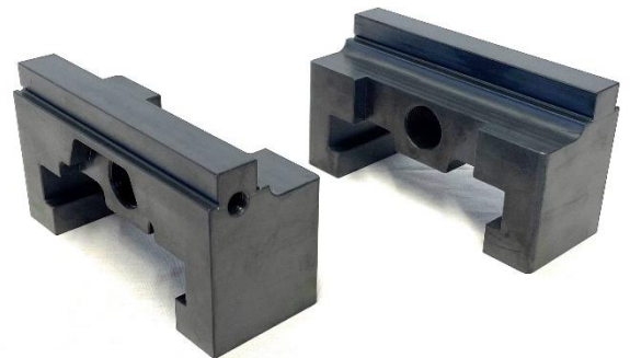
Backensatz mit glatter Spannstufe für RS-Z125