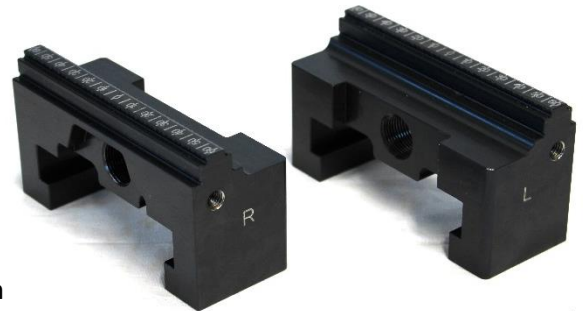
Kombi-Backen mit glatter und 3mm-Grip-Spannstufe für RS-Z125