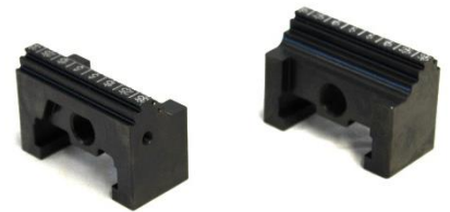
Kombi-Backen mit glatter und 3mm-Grip-Spannstufe für RS-Z75